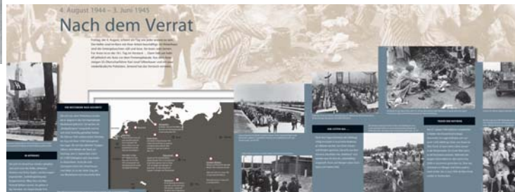
Die Geschichte von Anne Frank wird im historischen Kontext erzählt.

Die persönliche Geschichte Anne Franks wird verbunden mit der Geschichte der Weimarer Republik, des Nationalsozialismus, der Judenverfolgung, des Holocaust und des Zweiten Weltkriegs. Neben der Perspektive der Verfolgten und ihrer Helfer wird die Perspektive von Mitläufern und Tätern dargestellt.