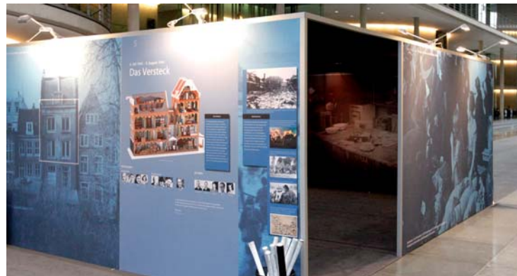
Der Gedankenraum mit Audiozitaten von Anne Frank ist Kernstück der Ausstellung.

Kernstück der Ausstellung ist der Gedankenraum, der sich der langen Zeit im Versteck widmet. Audiozitate würdigen Anne Frank als Tagebuchschreiberin und Chronistin ihrer Zeit. Sie ermöglichen ein Nachdenken über die Parallelen und Unterschiede zwischen gestern und heute. Die Ausstellung zeigt auch die Geschichte des Tagebuchs seit dessen Veröffentlichung.