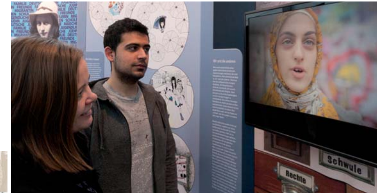
Im aktuellen Teil der Ausstellung: Identität, Gruppenzugehörigkeit, Diskriminierung und Engagement.

Wer bin ich? Was kann ich bewirken? Wer sind wir? Wen schließe ich aus?