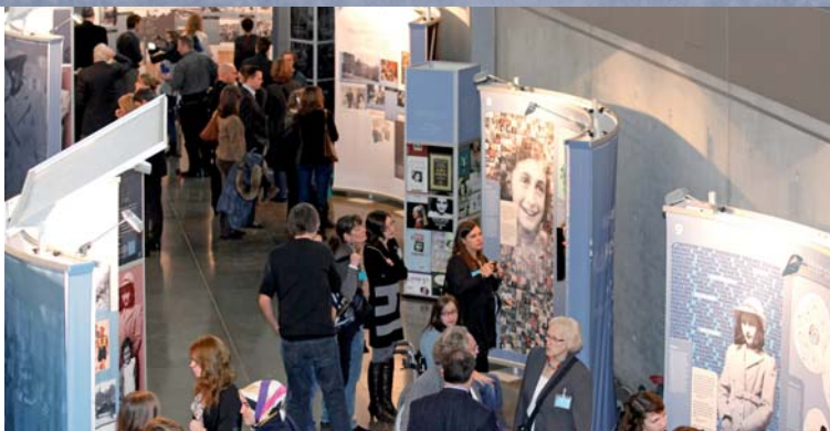
Die Ausstellung „Deine Anne“ schlägt eine Brücke vom Gestern ins Heute.