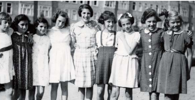
Anne Frank (2.v.l.) mit ihren Freundinnen an ihrem 10. Geburtstag in Amsterdam, 1939.

„Wie herrlich ist es, dass niemand eine Minute zu warten braucht, um damit zu beginnen, die Welt langsam zu ändern!“